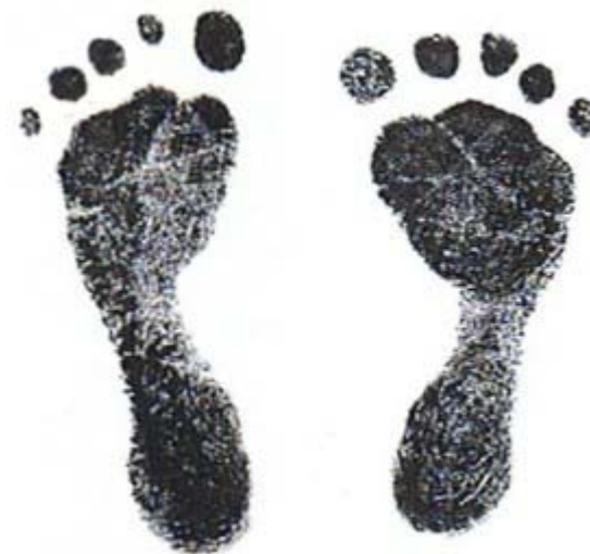
Cetakan kaki seorang bayi anencephaly bernama Anouk'

"Harapan bukanlah anggapan bahwa semua akan berakhir baik-baik, akan tetapi ketekunan untuk mengusahakan sesuatu bagaimanapun hasilnya."